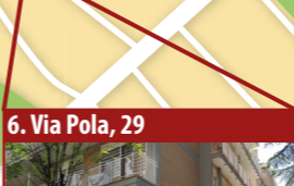
6. Via Pola, 29

Appartamento in condominio + box, garage, posto auto Tipo destinazione: mantenimento al patrimonio dello Stato. Ente destinatario: Anbsc. Scopo destinazione: finalità economiche Anbsc.