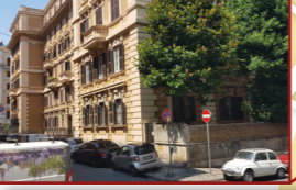
7. Via Ofanto, 18

Appartamento in condominio Tipo destinazione: mantenimento al patrimonio dello Stato. Ente destinatario: guardia di finanza. Scopo destinazione: fini istituzionali.