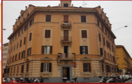
8. Via Dalmazia, 25

Appartamento in condominio, piano rialzato Tipo destinazione: trasferimento al patrimonio degli enti territoriali. Scopo destinazione: scopi sociali. Destinazione del bene: dipartimento Politiche sociali, sussidiarietà e salute – Associazione Casa Famiglia Rosetta.