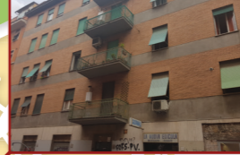
10. Via degli Equi, 31

Appartamento in condominio, mq 60 circa Tipo destinazione: trasferimento al patrimonio degli enti territoriali. Ente destinatario: guardia di finanza. Scopo destinazione: dipartimento Politiche abitative – Emergenza abitativa.