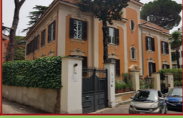
2. Via Adelaide Ristori, 30

Appartamento mq 245 circa + box, garage, posto auto mq 18 circa Tipo destinazione: trasferimento al patrimonio degli enti territoriali. Destinazione del bene: Il Municipio.