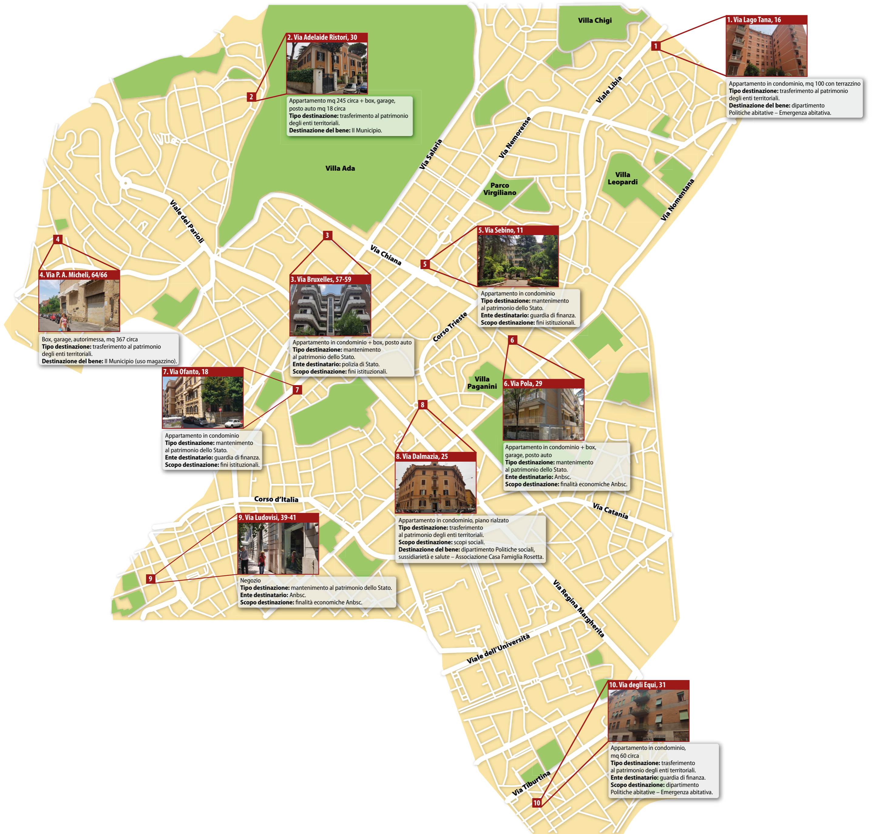
1. Via Lago Tana, 16