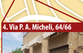
4. Via P. A. Micheli, 64/66

Box, garage, autorimessa, mq 367 circa Tipo destinazione: trasferimento al patrimonio degli enti territoriali. Destinazione del bene: Il Municipio (uso magazzino).