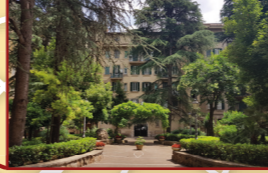
5. Via Sebino, 11

Appartamento in condominio Tipo destinazione: mantenimento al patrimonio dello Stato. Ente destinatario: guardia di finanza. Scopo destinazione: fini istituzionali.